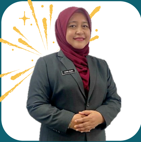
SEKAPUR SIREH, SEULAS PINANG

Assalamualaikum Warahmatullahi Wabarakatuh, Salam Sejahtera dan Salam Malaysia Madani.